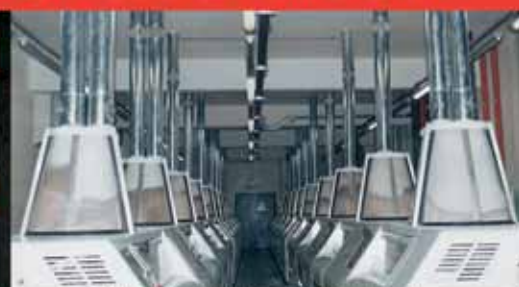
Molino "Quaglia" Vighizzolo d'Este (Padova)

La molteplicità dei particolari prodotti, permette la realizzazione di qualsiasi progetto relativo a tubazioni di condotta industriale in acciaio inox, senza perdere di vista l'obiettivo primario: facilità e riduzione dei tempi di montaggio.