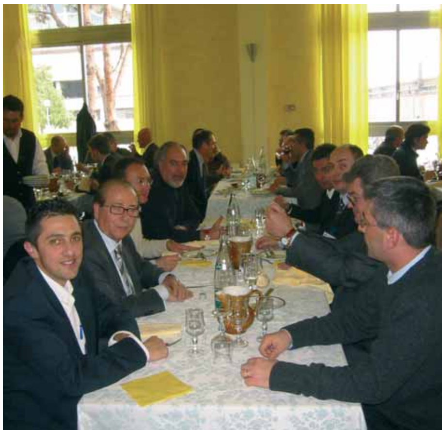
Un momento del pranzo: l'appuntamento conviviale è stato apprezzato da tutti i partecipanti.