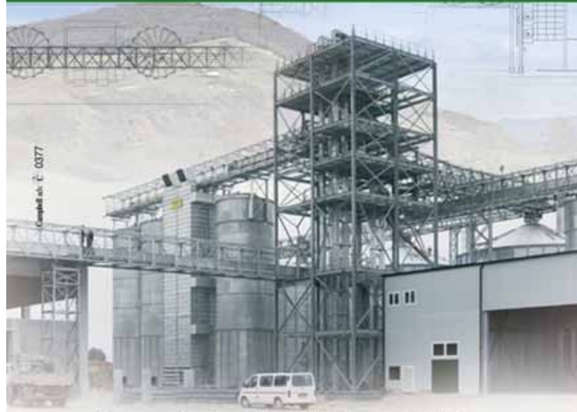
Consorzio Agrario di Bologna e Modena (Centro di Castelfranco Emilia)