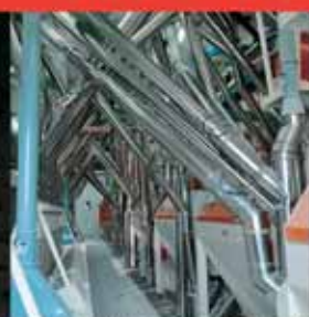
Molino "Padano" Ceneselli (Rovigo)