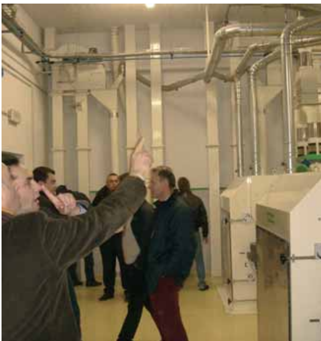
Alcuni partecipanti alla visita controllano i dettagli dell'impianto dei Molini Certosa, all'interno dello stabilimento di Corte de' Frati.

Gli adempimenti tecnici riguardano la diminuzione del rischio al livello voluto, il documento di zonificazione con alle-