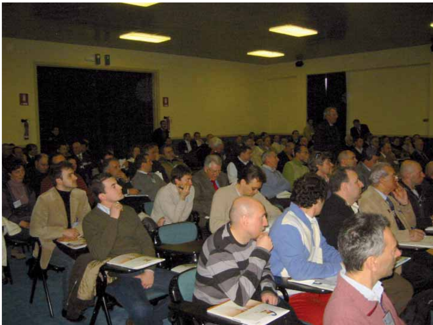
All'Incontro Tecnico ha partecipato una folta platea di addetti ai lavori, proveniente da ogni parte della Penisola.

inizio di ossidazione. Se un deposito di polveri combustibili contenente una zona calda in reazione viene movimentato, può avere luogo l'esplosione.