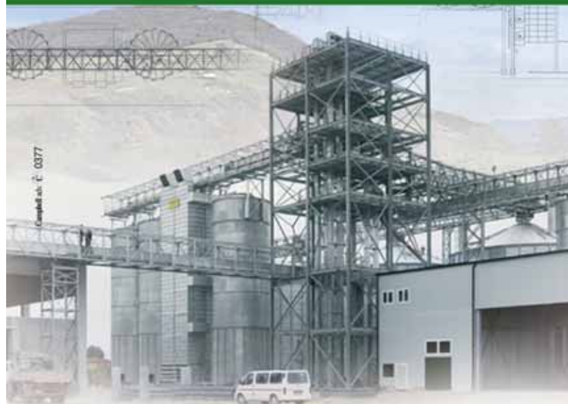
Consorzio Agrario di Bologna e Modena (Centro di Castelfranco Emilia)