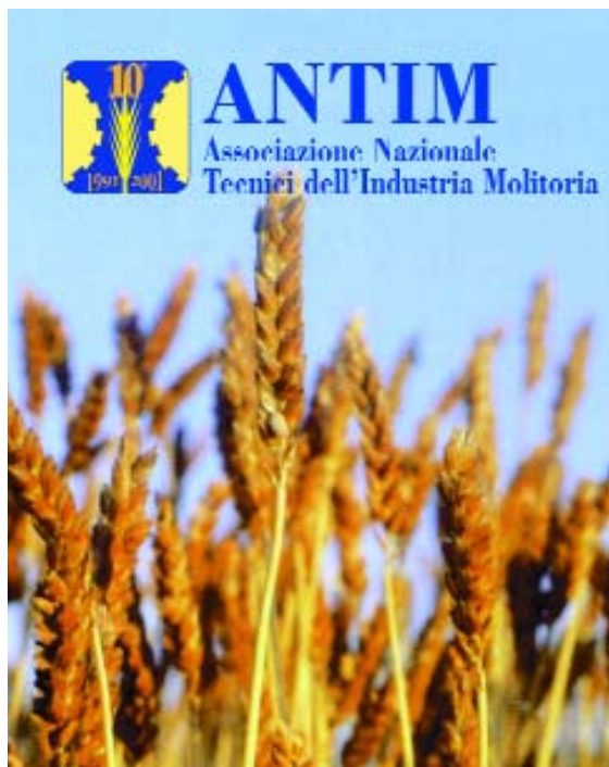
La brochure ideata per il decennale dell'Antim.